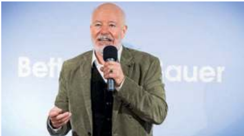
Bill Mockridge bei seinem Auftritt in unserem Haus