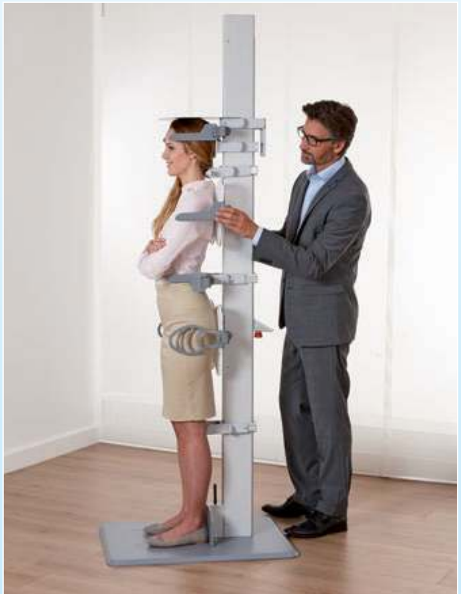
Modernes Gerät zur Ermittlung der richtigen Betausstattung: das Dormabell-Mess-System

Sowohl die Bettsystem-Vermessung als auch die NBA und die WBA wurden in Zusammenarbeit mit dem anerkannten Ergonomie-Institut München Dr. Heidinger, Dr. Jasper und Dr. Hocke GmbH, kurz EIM, entwickelt.