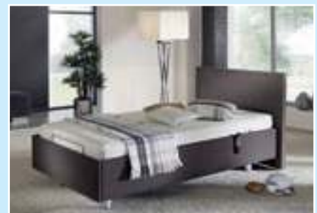
Stufenlose Anhebung um bis zu 38 cm – Maximale Höhe mit Matratze 100 cm Polsterbett „Meran“