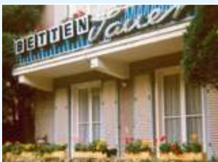
Rinderweg 15 in Köln-Brück