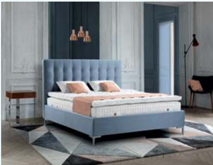
Feinste Polsterbetten von Treca mit handgefertigten Boxspring-Matratzen