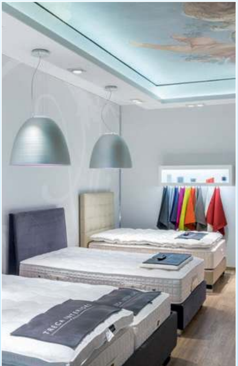
Unser brandneues Treca - Studio