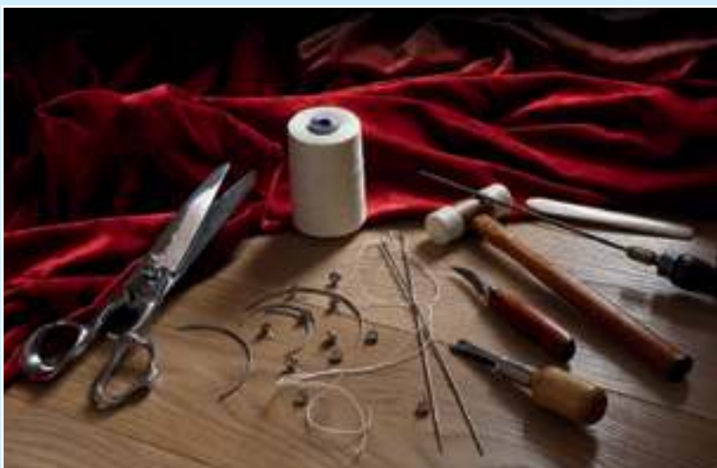
Höchste Kunst: Matratzenfertigung in Handarbeit