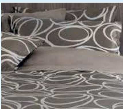
Zimmer & Rhode by Schloßberg „Move“