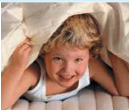
Nicht die Füllung verursacht Allergien

Sie haben es sich zur Aufgabe gemacht, Produkte und Konzepte zu entwickeln, die den Ansprüchen und Bedürfnissen einer modernen Gesellschaft gerecht werden. Das Ziel, das in der täglichen Arbeit verfolgt wird, ist der komfortable, erholsame Schlaf. Dabei wird größter Wert auf die Qualität der Materialien und neueste Technologien in der Verarbeitung gelegt. Manufakturarbeit setzt besonderes, handwerkliches Geschick voraus, welches alle Mitarbeiter Tag für Tag mit einbringen. Es sind deren Erfahrungen und Fähigkeiten, die den Produkten das Besondere und Einzigartige verleihen.