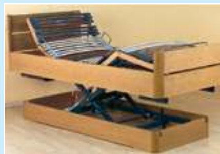
Komfortbett „Bern“ mit eingebautem Heberahmen „Homematic“

unsichtbar in vorhandene Betten oder Betten von BETTEN-SAUER eingebaut werden. Ebenfalls elektrisch verstellbar ist zusätzlich das Kopf-, Rücken- und Fußteil. Außer den Einbaurahmen sind komplette Holz- oder Polsterbetten incl. bereits eingebauten Heberahmen erhältlich, die komplett hochfahren. Die Höhenverstellbarkeit erleichtert auch die Arbeit der Hilfen bei Pflegefällen.