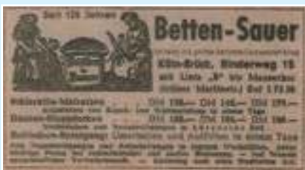
Anzeige im Kölner Stadt-Anzeiger im Jahre 1948