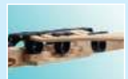
Mehrstufig einstellbare Schulterkomfortzone