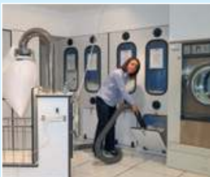
Herstellung, Umarbeitung, Neubezug und Auffüllung Ihrer Bettwaren im einzigen Federatelier Kölns mit modernsten Maschinen