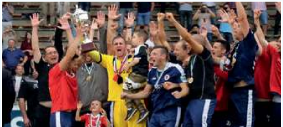
So freuen sich Pokalsieger