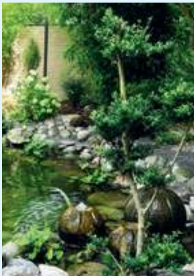
Der „japanische“ Firmengarten

www.betten-sauer.de E-Mail: info@betten-sauer.de