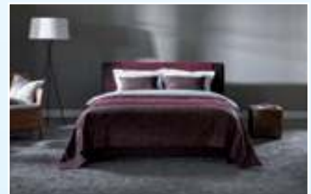
Origins – Change

Die Spezialisten von BETTENS AUER beraten Sie ausführlich und kompetent, damit Sie Ihr Traumbett finden.