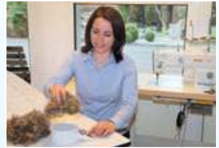
Die „Königin“ unter den Daunenn: Die Eiderdaune

Seit über 190 Jahren fertigen wir alle Daunendecken und Federkissen selbst an. Der Vorteil für Sie: Alle von uns eingekauften Daunenn und Federn werden überprüft und jedes von Ihnen bestellte Teil kann