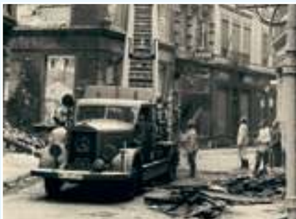
Martinstraße 45 im Jahr 1942