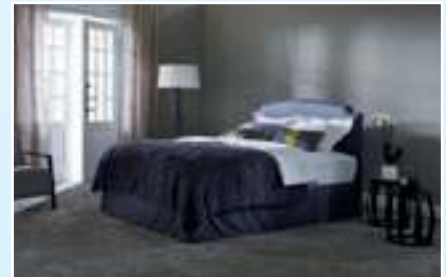
Origins – Louis XVI