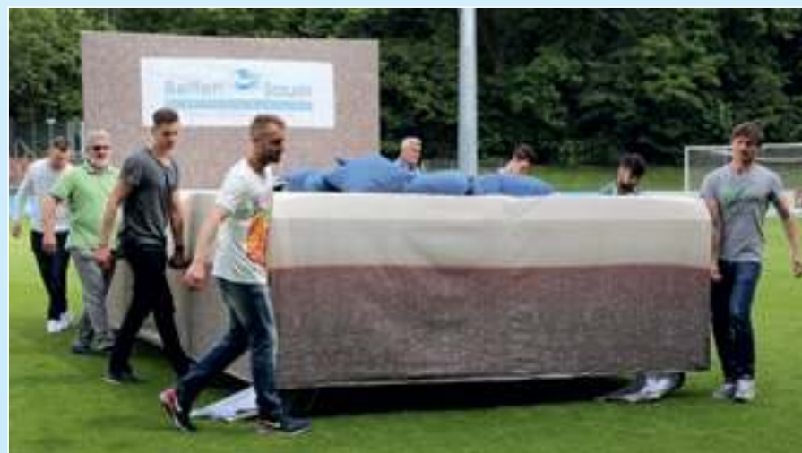
Das größte Bett von Betten-Sauer auf dem Fußballplatz von Viktoria Köln.

Im dritten Schritt bieten wir jedem Spieler, der das testen möchte, eine individuelle Schlaf- und Liegediagnostik bei uns im Fachgeschäft an. Denn nur, wenn Lattenrost, Matratze und Kissen optimal auf den Körper, also auf Größe, Gewicht, Schulterbreite etc. abgestimmt sind, kann sich der Körper in der Nacht optimal regenerieren.“