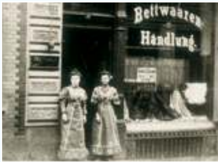
Gründungshaus in der guten alten Zeit