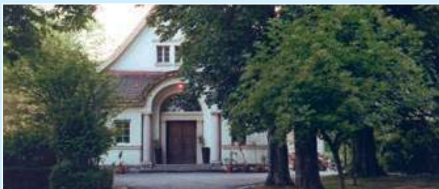
Der Firmensitz – das frühere Wasserwerk von Münster-Sarmsheim