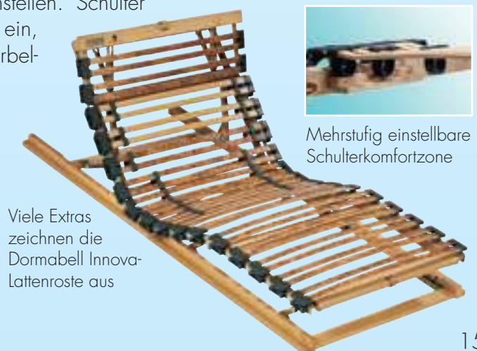
Viele Extras zeichnen die Dormabell Innova-Lattenroste aus