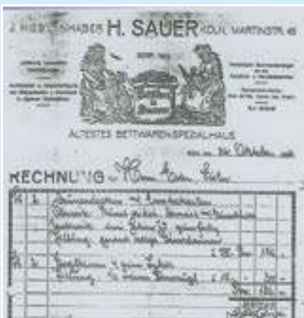
Rechnung aus dem Jahr 1934

Seit 193 Jahren und seit sechs Generationen verfügen wir in Deutschland über die längste Erfahrung in Herstellung, Verkauf und Pflege hochwertiger Bettwaren. Unsere Firmenphilosophie ruht seit dem Jahr 1823 bis heute auf drei starken Säulen: Qualität für höchste Ansprüche, Beratung ausnahmslos durch ausgebildete Fachleute sowie zahlreiche Service-Leistungen.