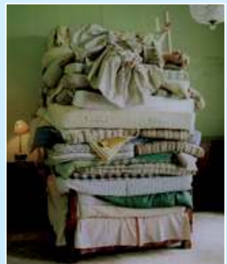
Zuchtanlage für Milben

BETTEN-SAUER ist in der Lage, alle Bettwaren in modernster Anlage zu waschen – egal welche Füllung diese beinhalten. Dies sollte, im eigenen Interesse, besonders von allen Allergikern, pünktlich erledigt werden.