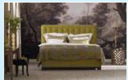
Origins – Quadro Plus